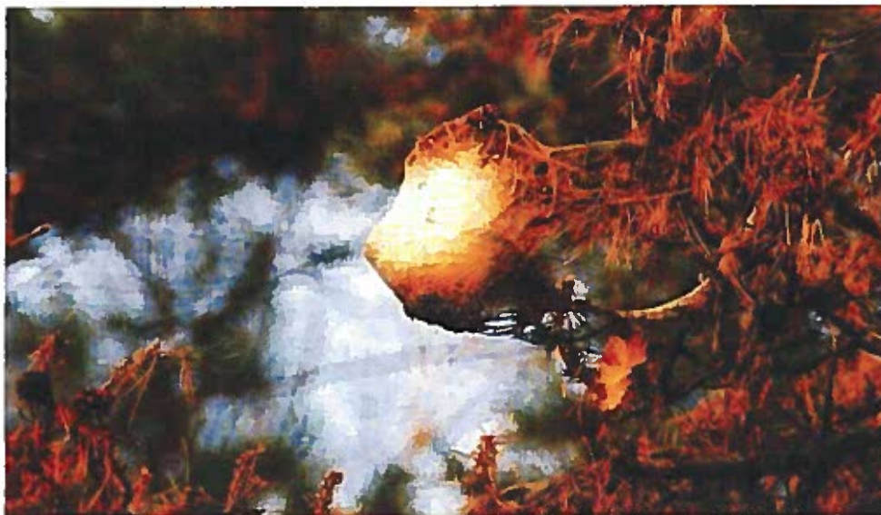
Nido di Thaumetopoea pityocampa.

In entrambi i casi lo scopo sarà quello di realizzare un ambiente sfavorevole ed inidoneo alla vita della processionaria durante il suo ciclo di sviluppo.