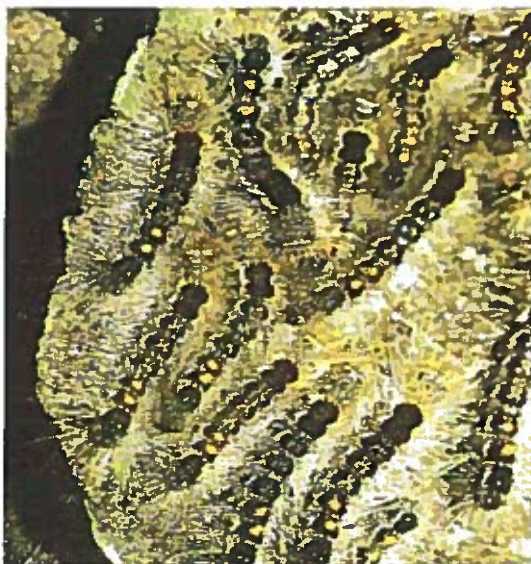
Giovani larve di E. Chrysorrhoea

Danni: le larve nascono e divengono attive nel pieno dell'estate, dalla fine di luglio alla metà di agosto. Hanno colore bruno nerastro, sono dotate di setole biancobruno (dalle proprietà urticanti) e sul dorso sono provviste di tubercoli color arancio. Ai lati del corpo si notano delle striature longitudinali bianco - arancio. Le larve manifestano tendenze gregarie. Le foglie delle piante ospiti (quercia, tiglio, acero, pioppo, carpino, rosacee e fruttifere varie) vengono ridotte alla sola nervatura. L'attacco determina dunque diffuse defogliazioni delle specie vegetali attaccate, che subiscono indebolimento e predisposizione ad altre malattie. Le modalità di lotta sono analoghe a quelle per Hyphantria Cunea .